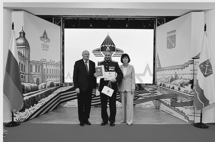
На церемонии вручения дипломов выпускникам первого потока программы «Герои Команды 47»

ПЕРВОГО ПОТОКА «ГЕРОЕВ КОМАНДЫ 47» ПОЛУЧИЛИ РАБОТУ ПО ПРОФИЛЮ ЕЩЁ ДО ПОЛУЧЕНИЯ ДИПЛОМОВ, ИЗ НИХ 13 УЖЕ ВЫШЛИ НА СЛУЖБУ В РЕГИОНАЛЬНЫХ И МУНИЦИПАЛЬНЫХ ОРГАНАХ ВЛАСТИ И УЧРЕЖДЕНИЯХ