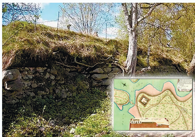
23 августа 1809 года император Александр I подписал «Указ об уничтожении укреплений в Старой Финляндии по прежней границе», во исполнение которого были упразднены Перновские («Суворовские») редуты на реке Пярна (ныне Тихая).