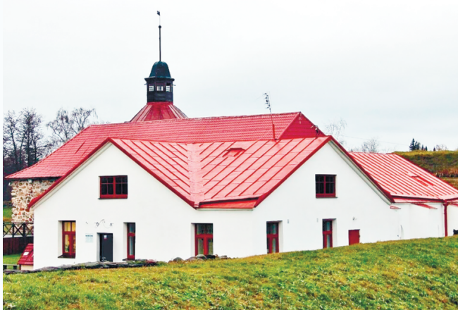
В крепости Корела Суворов лично руководил строительством арсенала, а на флагере крепостной башни сохранилась дата последнего посещения крепости Александром Васильевичем