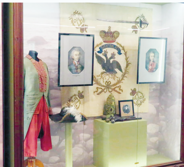
За столь короткий срок ответственное задание императрицы было выполнено.

В обосновании было сказано: «В память А. В. Суворова, который в 1791–1792 годах находился на Карельском перешейке и руководил работами по укреплению и инспектированию русских войск». Однако этот вариант не удовлетворил комиссию по переименованию, и Указом Президиума Верховного Совета РСФСР от 1 октября 1948 года Кексгольм был переименован в Приозерск.