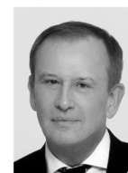
АЛЕКСАНДР ДРОЗДЕНКО, ГУБЕРНАТОР ЛЕНИНГРАДСКОЙ ОБЛАСТИ

Сейчас в Ленобласти тренируются почти два десятка детских хоккейных команд, команды любителей и ветеранов. Хотим предоставить им максимальную возможность играть. Жить в спорте. Командные виды спорта здорово развивают и скорость, и выносливость, и стратегическое мышление.