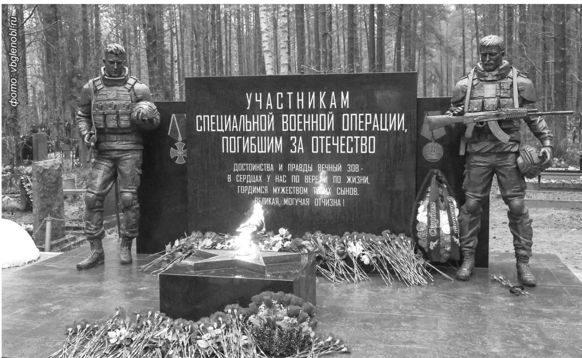
Мемориал на Верхне-Черкасском кладбище открыт в декабре прошлого года

В последние годы Россия переживает период глубоких изменений, связанных с проведением специальной военной операции. Этот сложный и многогранный процесс затрагивает все аспекты жизни общества. Одним из важных проявлений памяти о подвигах наших современников стало появление новых памятников и мемориалов, посвящённых бойцам СВО.