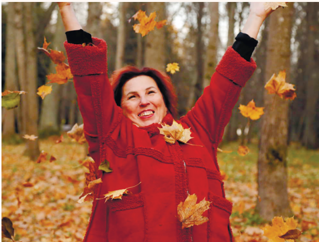
Продолжение, начало в № 44 от 7 ноября 2024 г. АПЕЛЬСИНОВЫЙ ГОРОД

Вечером первого дня нашего СМИшного путешествия я перенеслась... в детство. Мы совершили замечательную прогулку в Ораниенбаум – дворцово-парковый ансамбль, музей-заповедник в городе Ломоносов. Это единственный подобный памятник в окрестностях Санкт-Петербурга, не разрушенный в годы войны. Он не так популярен у туристов, как Петергоф, расположенный рядом, поэтому очередей здесь не бывает, можно все спокойно осмотреть. А поскольку мы были октябрьским вечером, парк оказался практически безлюдным.