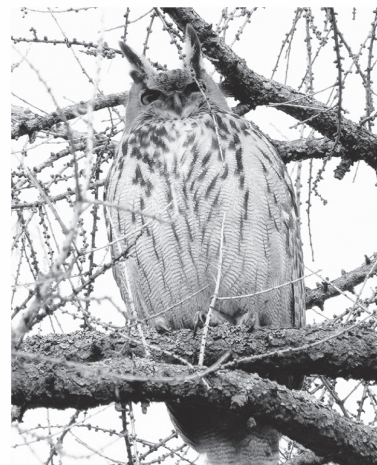
Филин — самая крупная сова в Ленобласти

У другой нашей совы «уши» из удлинённых перьев куда более заметны. За них она и получила своё видовое название: ушастая. Напомню: настоящие уши у сов — это два длинных отверстия по бокам головы, полностью скрытые под оперением. Величиной ушастая сова — с ворону. В окрасе её преобладают сероватые, рыжеватые и желтовато-бурые тона. Из всех сов нашего региона только у неё и у филина глаза — оранжевого цвета. Ушастая сова, как и болотная, в холодное время года улетает зимовать на юг.