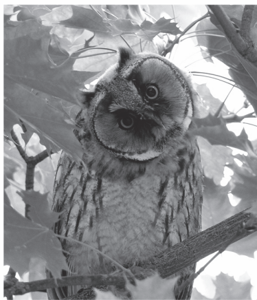
Ушастая сова в ленинградском лесу

Мохноногим его прозвали не случайно: ноги птицы действительно покрыты перьями до самых пальцев. Питается эта сова не только мышевидными грызунами и пернатыми, но может справиться и с белкой. Что до се-