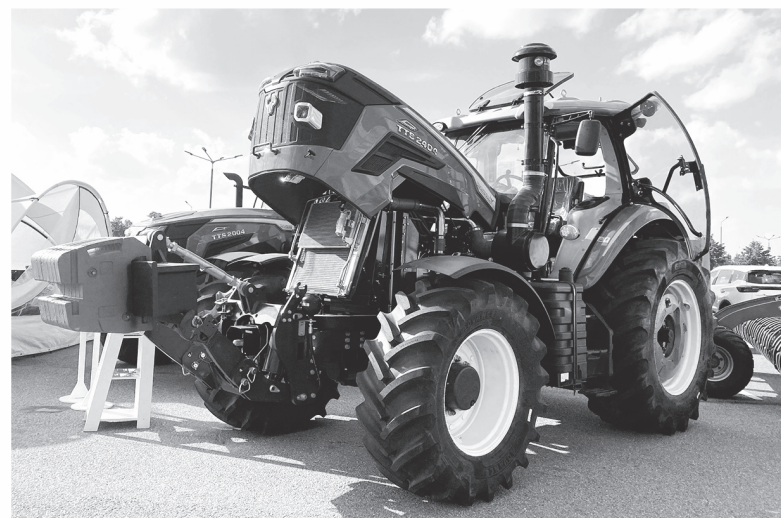
На выставке была представлена современная сельскохозяйственная техника отечественного производства