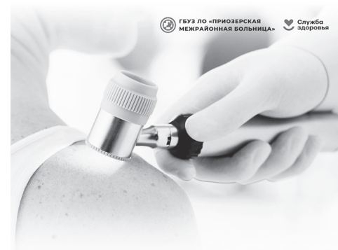
НЕДЕЛЯ ПРОФИЛАКТИКИ КОЖНЫХ ЗАБОЛЕВАНИЙ 2 – 8 сентября 2024

Психоэмоциональное состояние также играет роль в здоровье кожи. Хронический стресс может спровоцировать обострение таких заболеваний, как псориаз и экзема.