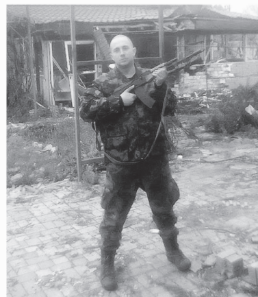
Во время службы на передовой

И в эту самую минуту их ждало спасение: парни увидели наши окопы и начали выкрикивать