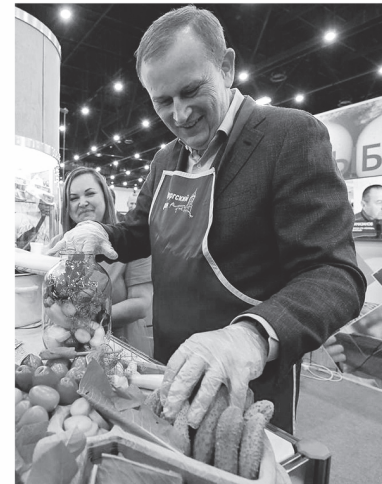
Мастер-класс по созданию заготовок на зиму

На ярмарке есть и другие ленинградские деликатесы — вкусные и полезные. Например, в палатке МПК «Потанино» предлагают попробовать богатые белком паштеты и натуральную тушёнку из говядины, свинины, индейки, а предприятие «Козья ферма» порадует обилием сыров и йогуртов на основе гипоаллергенного козьего молока. Не менее полезен и копорский иван-чай, в котором, как известно, больше витамина С, чем в лимоне и других цитрусах. Вот так пройдёшься по ярмарке — и со-