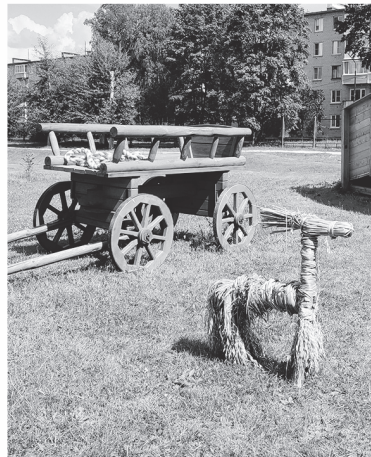
Фестиваль НКО украсила зона крестьянского быта

Главным событием Гражданского форума стал первый в Ленобласти Фестиваль некоммерческих организаций. В течение целого дня 25 сильнейших представителей сектора социальных инициатив презентовали коллегам и местным жителям свой опыт. Каждый раз это была не скучная лекция, а настоящая шоу-программа.