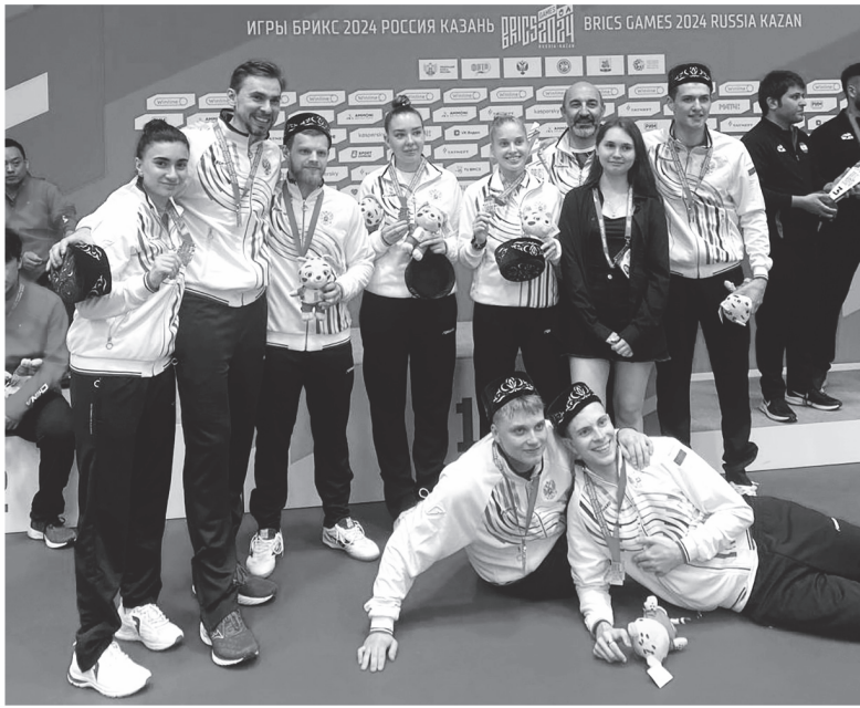
Сборная России по настольному теннису на Играх БРИКС

Пока Олимпийские игры в Париже утопают в череде скандалов и казусов, а другие международные соревнования утрачивают зрелищность без российских спортсменов, ленинградский спорт остаётся территорией успеха. О последних победах наших атлетов — в обзоре «Ленинградской панорамы».