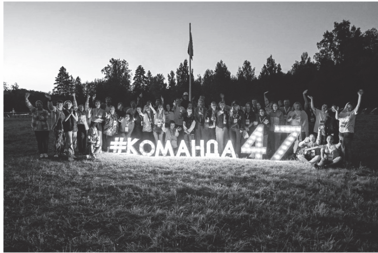
Участники Гражданского форума смогли насладиться природой Сланцевского района

На сегодняшний день в Сланцах действует лишь несколько социально ориентированных НКО, хотя у территории есть очевидный потенциал для развития. По задумке организаторов, трёхдневный десант самых активных представителей социальной сферы сможет вдохновить равнодушных местных жителей на запуск собственных проектов. Расчёт оправдал себя: на мероприятия форума приходили пенсионеры и молодёжь, опытные волонтеры и новички движения. Каждый мог узнать — как решиться на добрые дела, найти поддержку государства и даже создать собственную НКО с нуля.