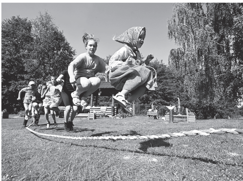
Представители НКО подготовили для местных жителей не только лекции, но и активные игры