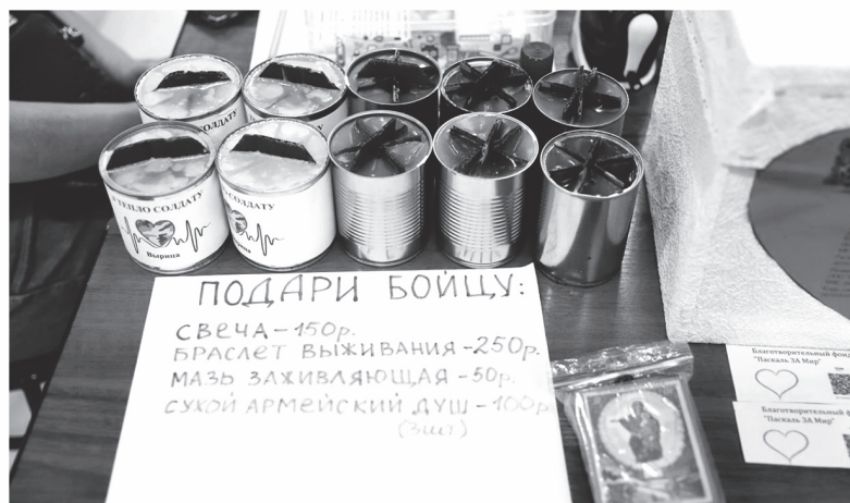
Благотворительная ярмарка в поддержку защитников Отечества в п. Новоселье