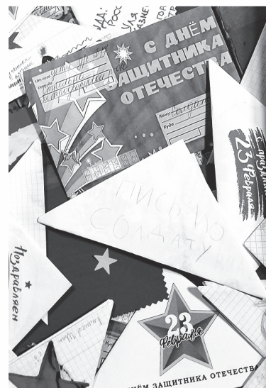
Письма бойцам от детей Ленобласти