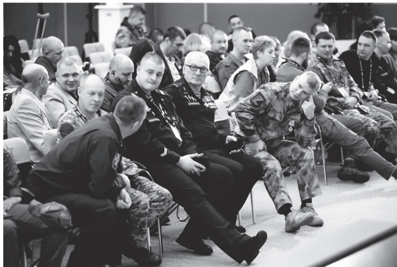
Участники Ассоциации ветеранов специальной военной операции Ленинградской области

ОБЩЕСТВЕННЫЕ ОРГАНИЗАЦИИ ЛЕНИНГРАДСКОЙ ОБЛАСТИ ПОДДЕРЖИВАЮТ УЧАСТНИКОВ СПЕЦОПЕРАЦИИ И ИХ СЕМЬИ