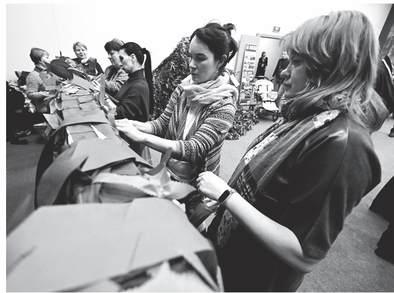
Женщины на мастер-классе по изготовлению маскировочных сетей