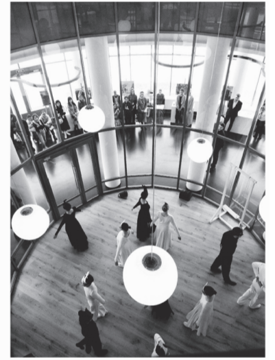
Выступление студентов областного колледжа искусств

Обращает на себя внимание стенд «Звук и цвет». Вы знали, что для Римского-Корсакова звуки были окрашены в разные оттенки? А о набоковской радуге букв? Он их видел красными, зелеными, чёрно-бурыми, синими... Такое свойство называется цветовой слух, или синописия. Что же до Рериха, то для него, художника, цвет был основным средством визуального языка. К слову, отправляясь в путешествие, он брал с собой грампластинки Римского-Корсакова.