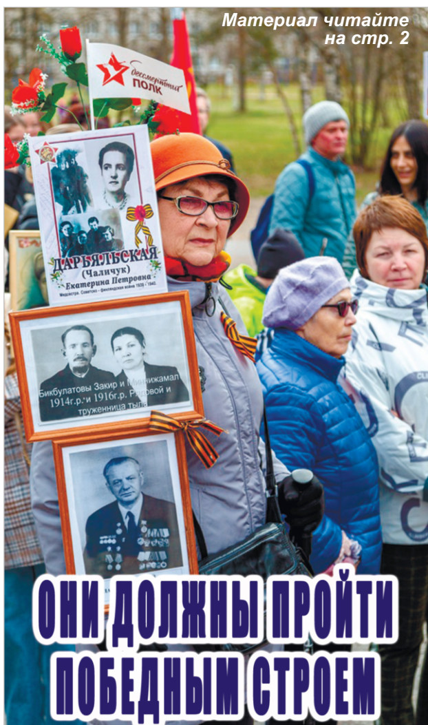
Материал читайте на стр. 2