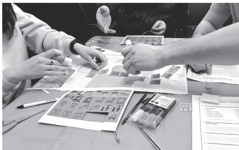
На проектировочной сессии жители посёлка могли выбрать наполнение проекта благоустройства

КСЕНИЯ БОНДАРЕНКО ФОТО АВТОРА, ЦЕНТРА КОМПЕТЕНЦИЙ ЛО