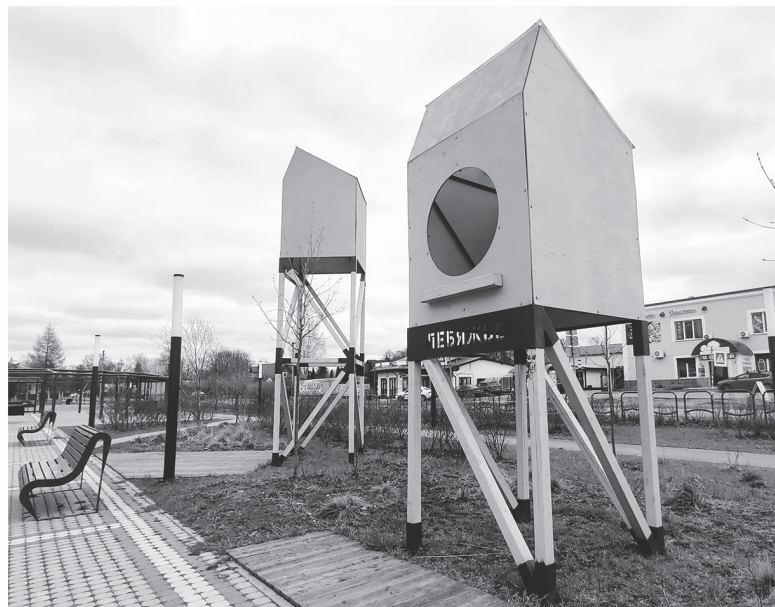
Птичья площадь в посёлке Лебяжье

В планах на 2025 год — благоустройство водоёма и сквера на улице Приморской. Туристам эти места знакомы по расположенному неподалёку штурмовику Ил-2 — памятнику «Защитникам ленинградского неба». Да и та самая Птичья площадь находится совсем рядом. Так что