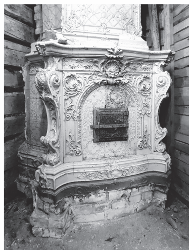
Старинный камин в усадьбе Киискиля