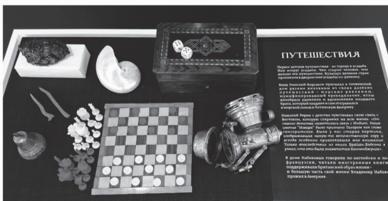
Дорожный набор путешественника начала XX века

Забавно рассматривать метафорические ландшафты усадеб, в которых выросли гении русской культуры. Это не точные макеты имений, а видение художника, рождённое после прочтения писем, воспоминаний, биографического набоковского романа «Другие берега».