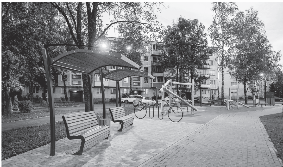
Общественное пространство в Пудомьягах вошло в список лучших объектов благоустройства Минстроя РФ

— Встречаемся и общаемся с жителями небольших населённых пунктов, где в 2025 году по президентскому нацпроекту «Жильё и городская среда» планируется благоустройство общественных территорий. Сначала