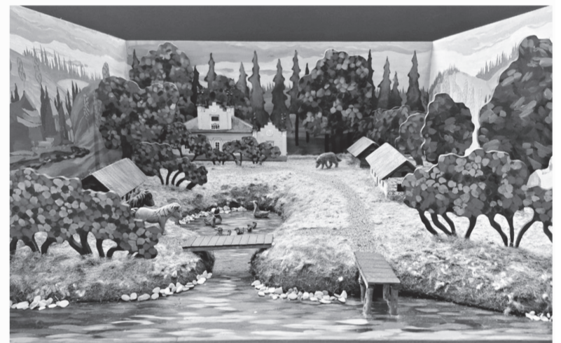
Усадебное детство связывает судьбы Набокова, Рериха и Римского-Корсакова

ЛЮДМИЛА КОНДРАШОВА