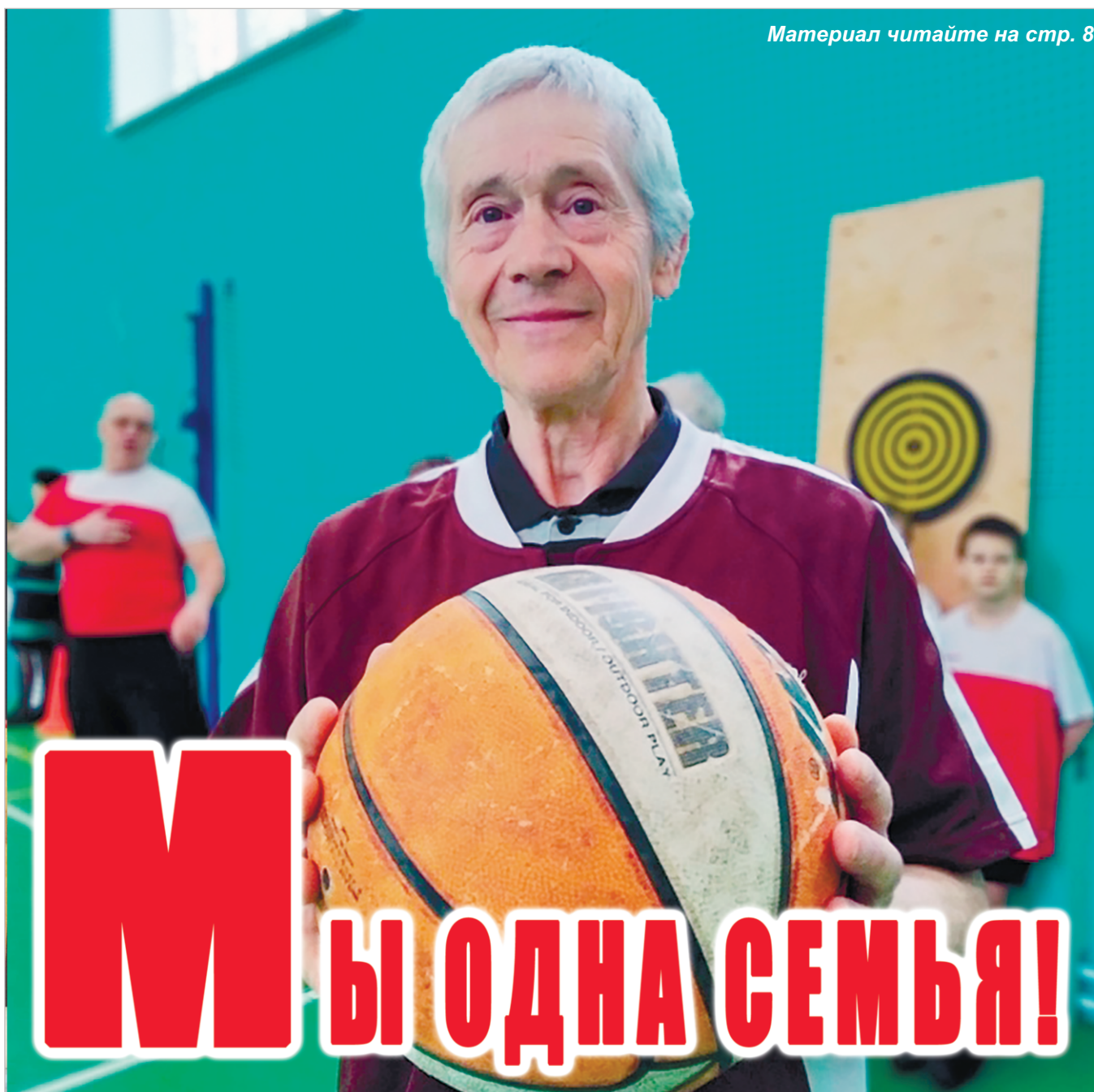
Материал читайте на стр. 8