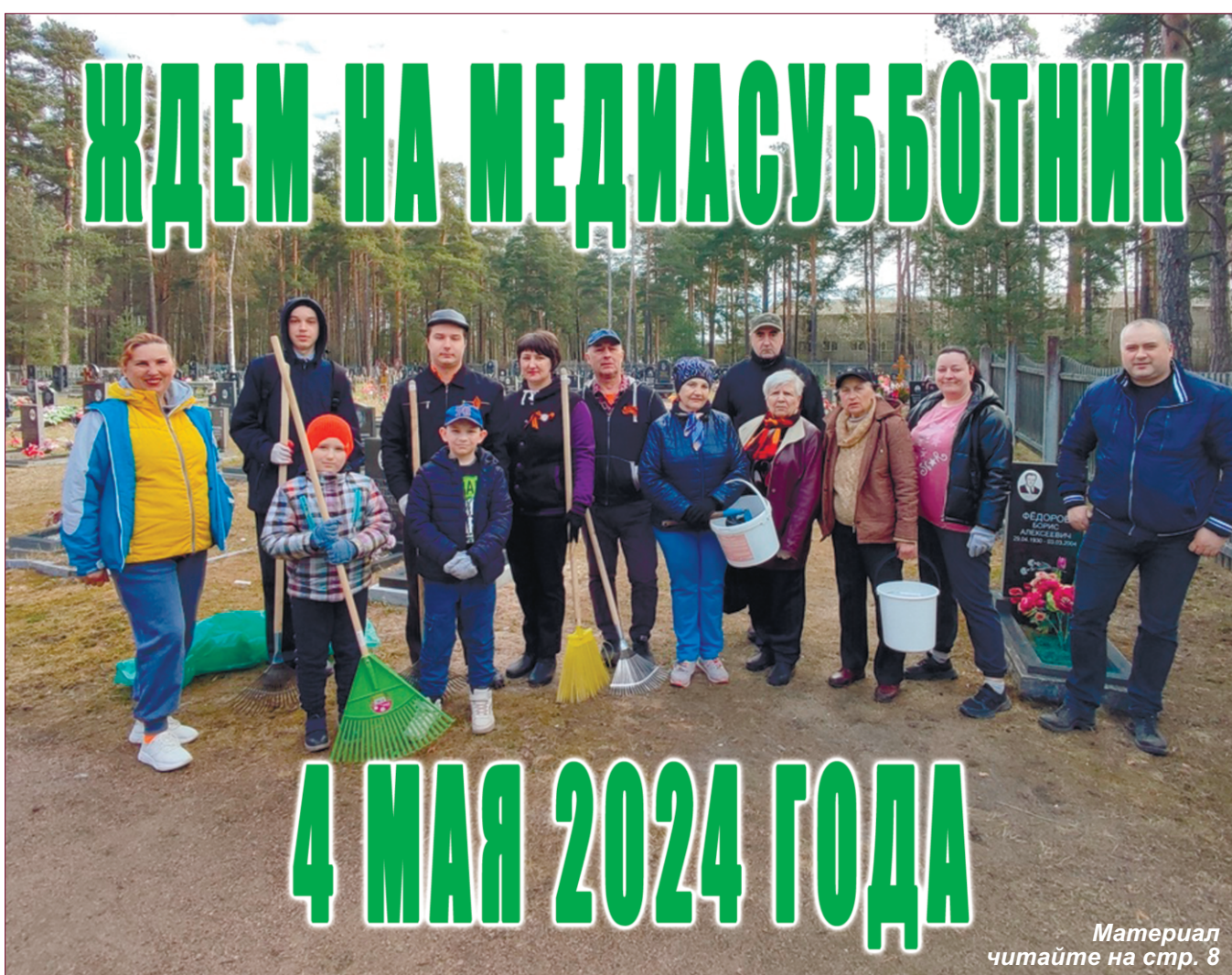
Материал читайте на стр. 8