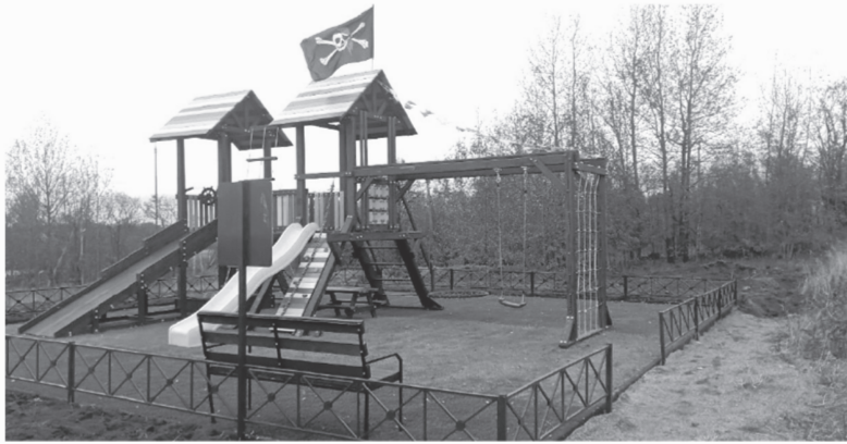
Обустройство детской игровой площадки в деревне Валяницы, Кингисеппский район

— За 10 лет благодаря механизмам инициативного бюджетирования было поддержано более 10 тысяч проектов, из бюджета области выделено порядка 3,5 млрд рублей. И если в 2013 году мы начинали с 60 млн, то в последние годы на поддержку инициативных проектов выделяется 460 млн рублей. Ежегодно порядка 4000 человек — активных и инициативных жителей области включены в местное самоуправление. Это 627 старост, почти 648 общественных советов, 52 ТОСа, а также почти 280 инициативных комиссий. В тысячах наших сёл, деревень, малых городов, где местный бюджет раньше не позволял решить все накопившиеся задачи, отремонтировали и осветили дороги, создали сотни детских и спор-