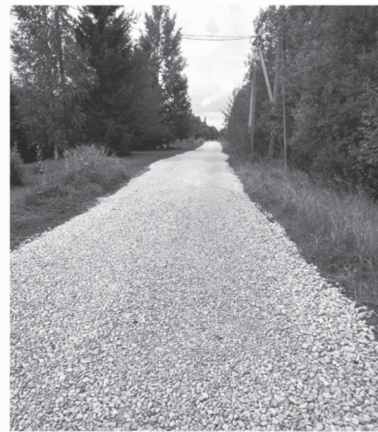
Ремонт дороги в деревне Новое Поддубье, Гатчинский район

Нашим комитетом постоянно совершенствуется областное законодательство в сфере самоуправления — сначала регион поддерживал старост, затем другие появившиеся формы местного самоуправления. И вот теперь всё объединено в одном законе. Это, на наш взгляд, будет стимулировать