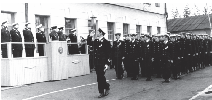
Прохождение торжественным маршем (1960-е гг.)