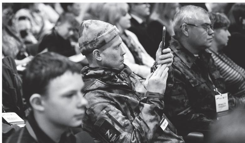
Участие в форуме приняли ветераны СВО, военные корреспонденты и волонтеры