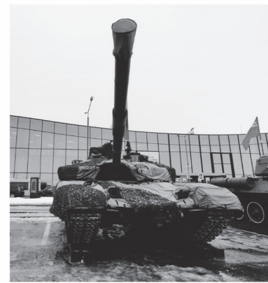
Гостей ждала выставка боевой техники

Центральным событием фестиваля стал первый региональный форум «Вместе победим». Его участниками стали ветераны СВО и родственники бойцов.