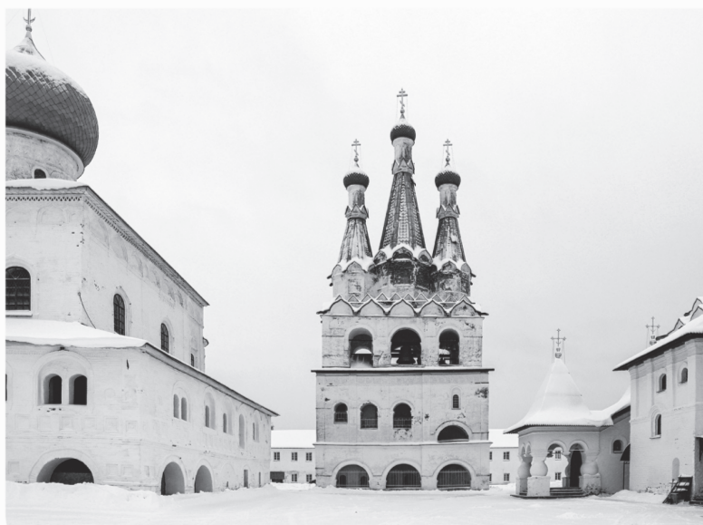
Александро-Свирский монастырь известен памятниками архитектуры XVI века