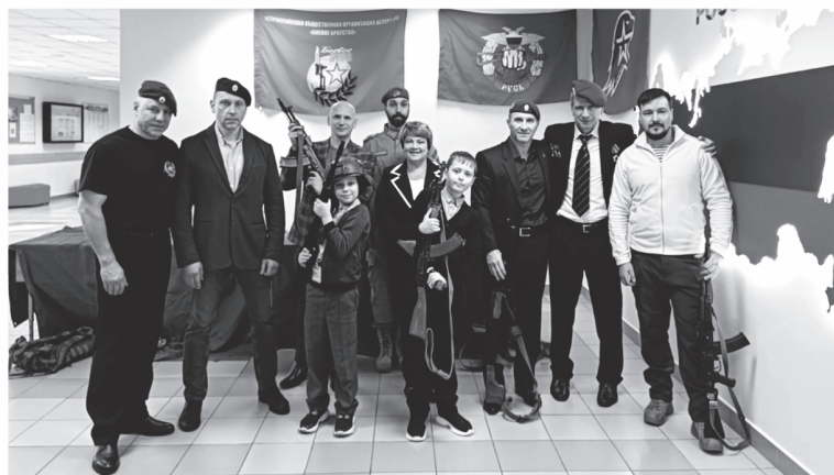
Команда «Боевого братства» проводит уроки мужества в школах Ленобласти

— Нам удалось собрать более 5 тыс. подарков. Это стало не просто региональной акцией, а все-