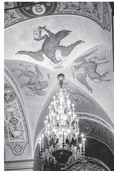
Внутреннее убранство одного из храмов монастыря

Но причём здесь Фиваида? Дело в том, что на заре утверждения христианства состоялся «великий исход» отшельников в египетскую пустыню, где постепенно сложилась своего рода зона расселения святых от-