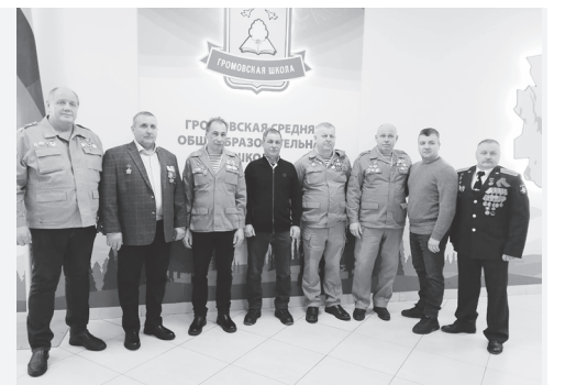
патриотизма, задумались над тем, наследниками каких высоких гражданских традиций они являются, ведь народ, не забывающий своих героев, бессмертен.