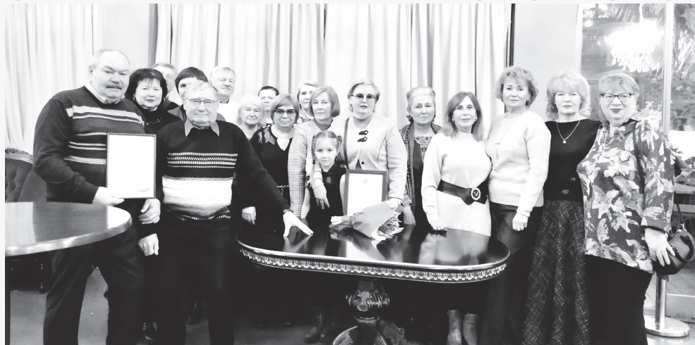
19 февраля 2024 года. ДК им.Ленсовета (г. Санкт-Петербург) Делегация Приозерского района

Беседовала Анна Кульчицкая