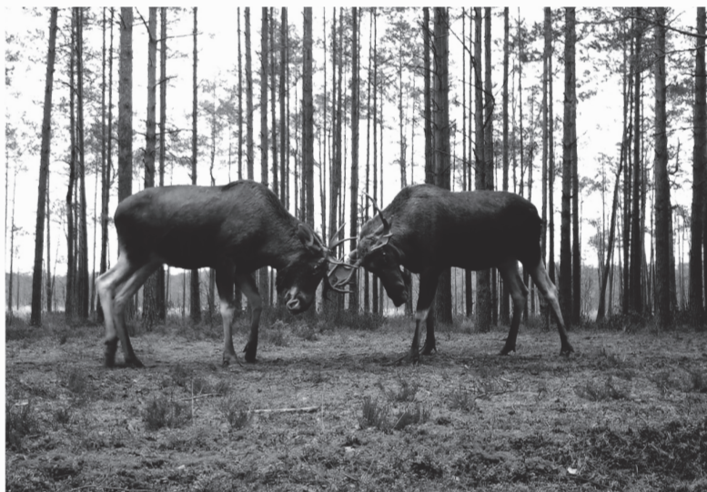
Фотолушка засняла схватку двух лосей

Мужская «корона» активно растёт примерно до конца июля.