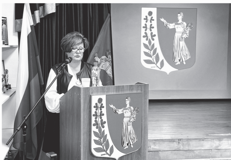
Представители местной власти отчитываются об итогах работы в 2023 году

В поселениях Ленинградской области с января проходят традиционные отчётные собрания. Главы муниципальных образований делятся достижениями за 2023 год, рассказывают о рабочих планах и отвечают на вопросы местных жителей.