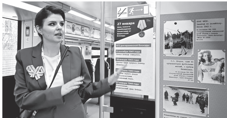
Пассажиры «Ласточки» смогут узнать больше о блокаде и освобождении Ленинграда