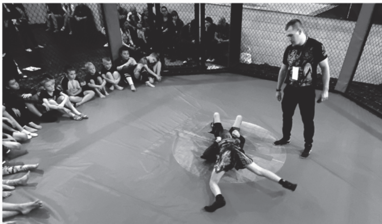
В Выборге спортсмены передают свой опыт подрастающему поколению