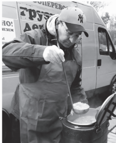
Волонтеры «Пятого угла» кормят бездомных

годня», направленный на сохранение памяти о героях Великой Отечественной войны. Всё началось с небольшой патриотической акции в посёлке Плодовое Приозерского района. Местные добровольцы вместе со школьни-