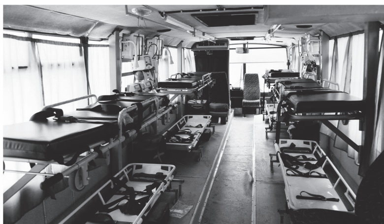
Уникальный реанимационный автобус для нужд фронта

Совместный проект фонда «Ленинградский рубеж» и Комтранса Ленобласти по модернизации гражданского транспорта