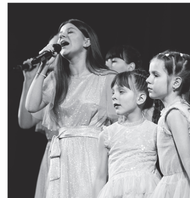
Концерт юных талантов Донбасса и Ленобласти

Помимо медицинской и социальной поддержки фонд «Ленинградский рубеж» не забывает и про образовательную составляющую. В течение прошлого года на передовой работали классы обучения на сварщиков в интересах наших ремонтных батальонов. Преподавателей сварочного мастерства из областных вузов пригласили в командировку на полтора-два месяца в зону СВО. Задача стояла непростая: превратить трёхлетний курс подготовки в интенсив на полтора-два месяца. Всё получилось. Ребятам обучили, снабдили всем необходимым — так рембат получил новые рабочие руки!