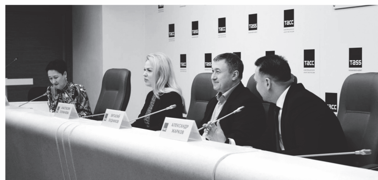
Пресс-конференция фонда «Ленинградский рубеж» о планах на 2024 год

АЛЕКСАНДРА РОДИОНОВА