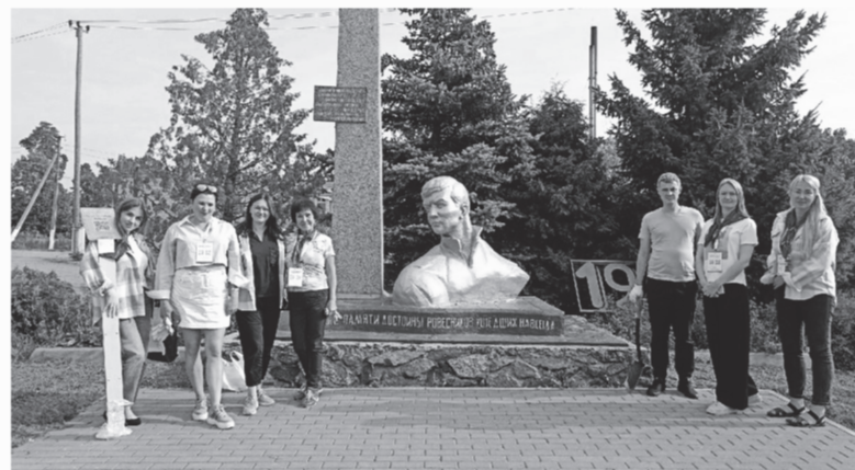
Жители Плодового обустроили территорию вокруг памятника неизвестному солдату