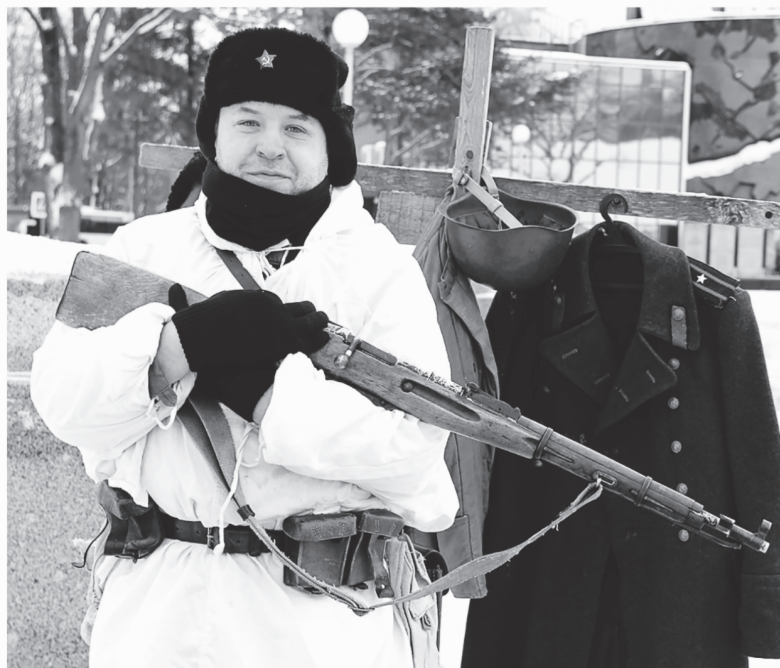
Гостей музея учили обращению с оружием времён Великой Отечественной войны