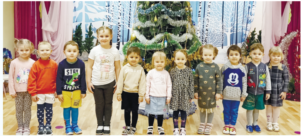
и становится ярким и логичным завершением Нового года.

Праздник яркий, богатый впечатлениями, незабываемый, полный волшебных звуков и красок, оставляет яркий след в душе ребенка