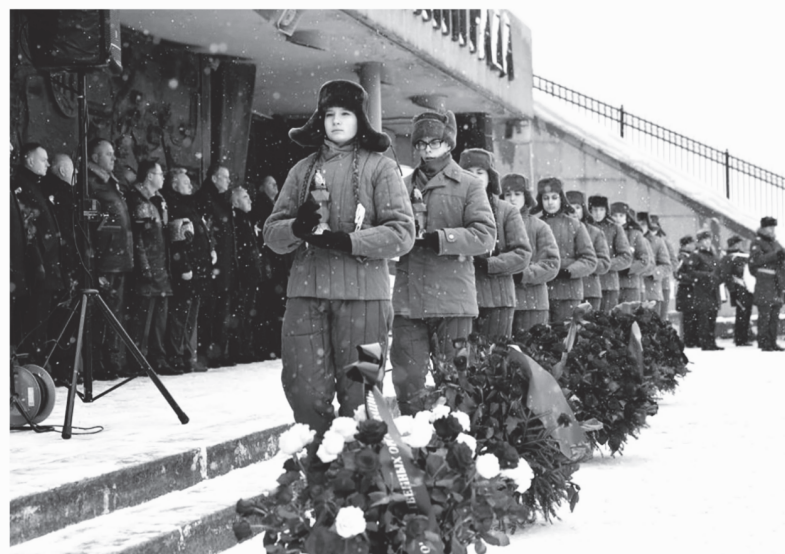
Участники церемонии почтили память павших в годы блокады минутой молчания

Мероприятие началось с концертного номера «Гранитный Ленинград» в исполнении музыкального альянса «Петербургские баритоны» с участием ансамбля танца «Фейерверк». Сразу после вокального номера и звуков Гимна Российской Федерации со словами поздравления к собравшимся обратился Губернатор Ленинградской области.