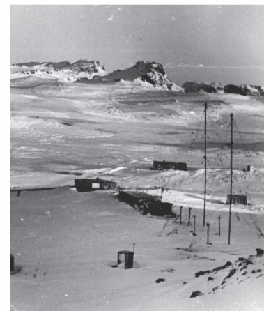
Станция «Беллинсгаузен» в Антарктиде

Николай Александрович отмечает — сегодня техническое оснащение учреждений здравоохранения зачастую стало лучше, однако появилась но-