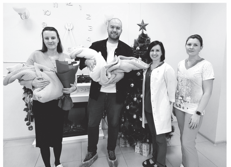
ФОТО: ПЕРИНАТАЛЬНЫЙ ЦЕНТР ЛОКБ