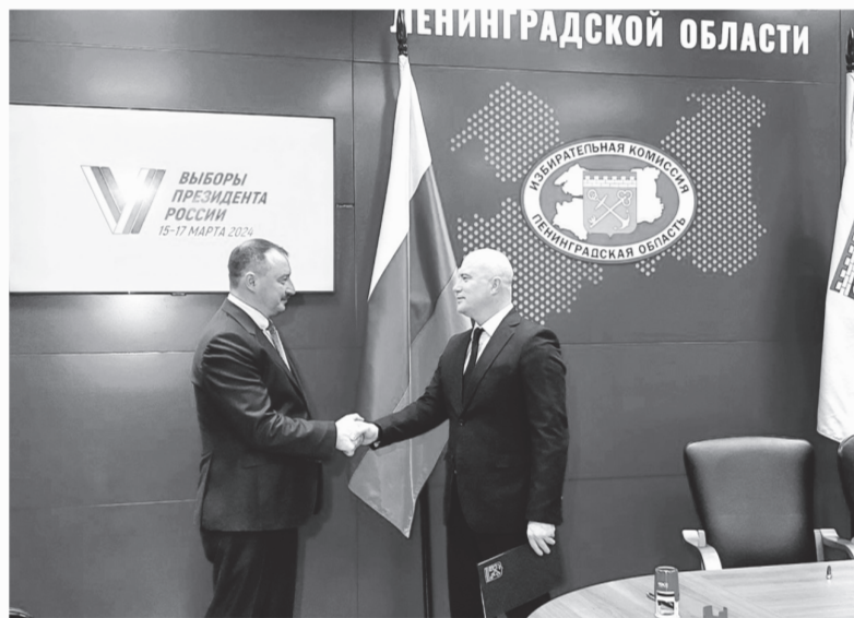
Леноблизбирком и «Почта России» заключили соглашение о сотрудничестве

Менее двух месяцев остаётся до трёхдневного голосования на президентских выборах 2024 года. Мы узнали у Избирательной комиссии Ленинградской области, как регион готовится к этому событию.