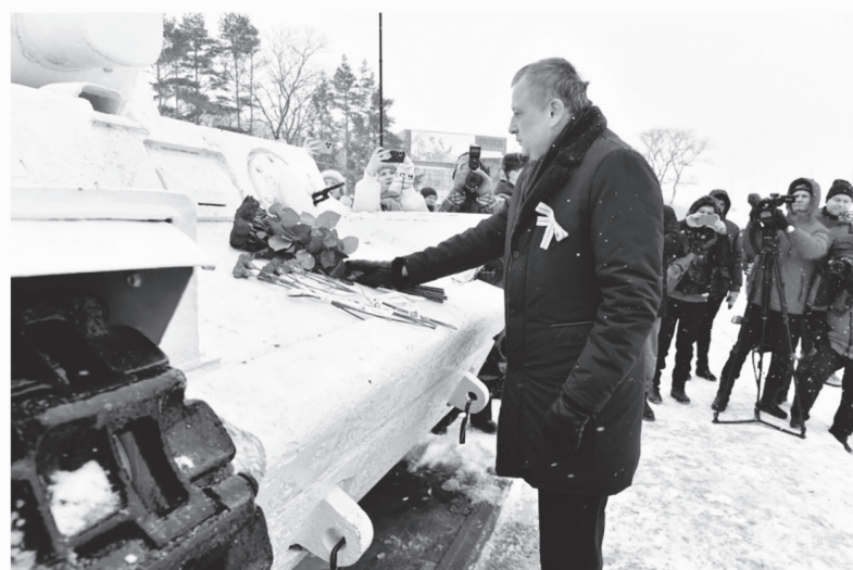
Александр Дрозденко возложил цветы к монументу «Белый танк»